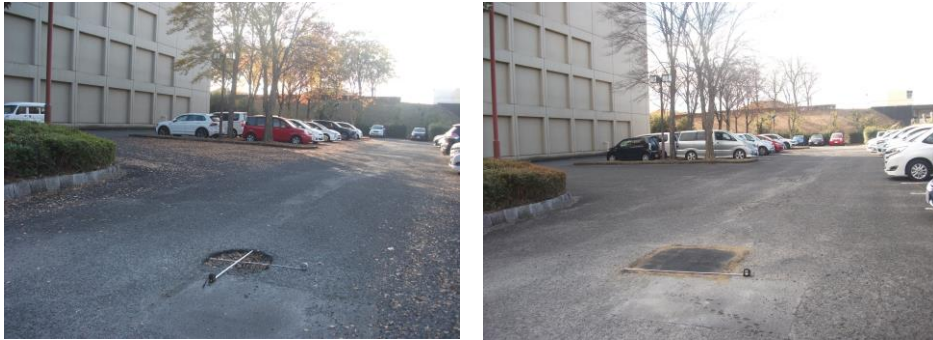
2・ 39・大学会館外来駐車場通路