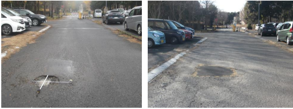
1・ K25・第三エリアゲート内通路