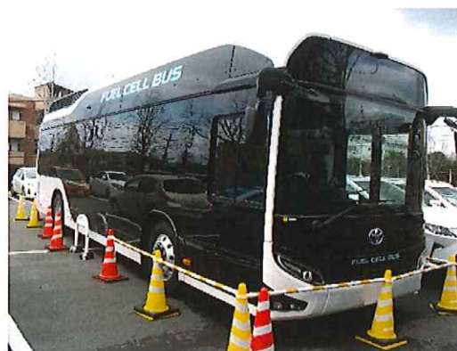
バス 4 台分の確保

令和元年度は、病院 PFI 業者の駐車場利用削減計画に基づき、桐仁会からは 6 名が撤退。IIS は当年度、事業拡張等に伴い、教職員等を 8 名増員。