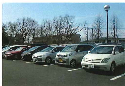
バス撤去後の駐車状況