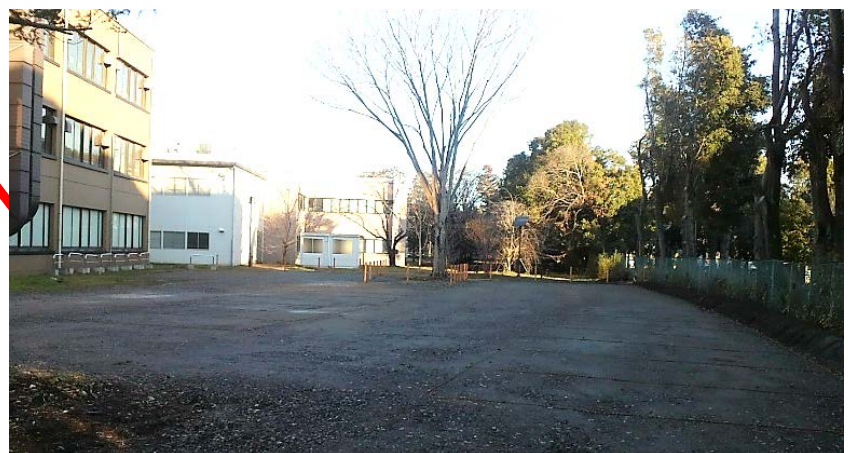
剪定及び区画ロープ張り、砕石整正後