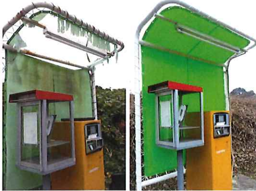
K7・体芸西・出口ゲート